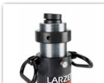
Cabeza Basculante opcional.