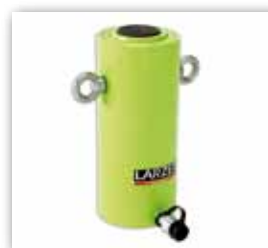
Cilindros Simple Efecto y Baja Altura, Alto Tonelaje, SPR.