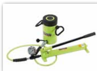
Juego Cilindro y Bomba.