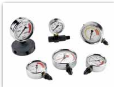
Manómetros de Presión.