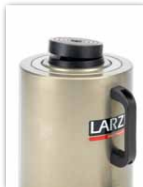
Cabeza Basculante opcional.